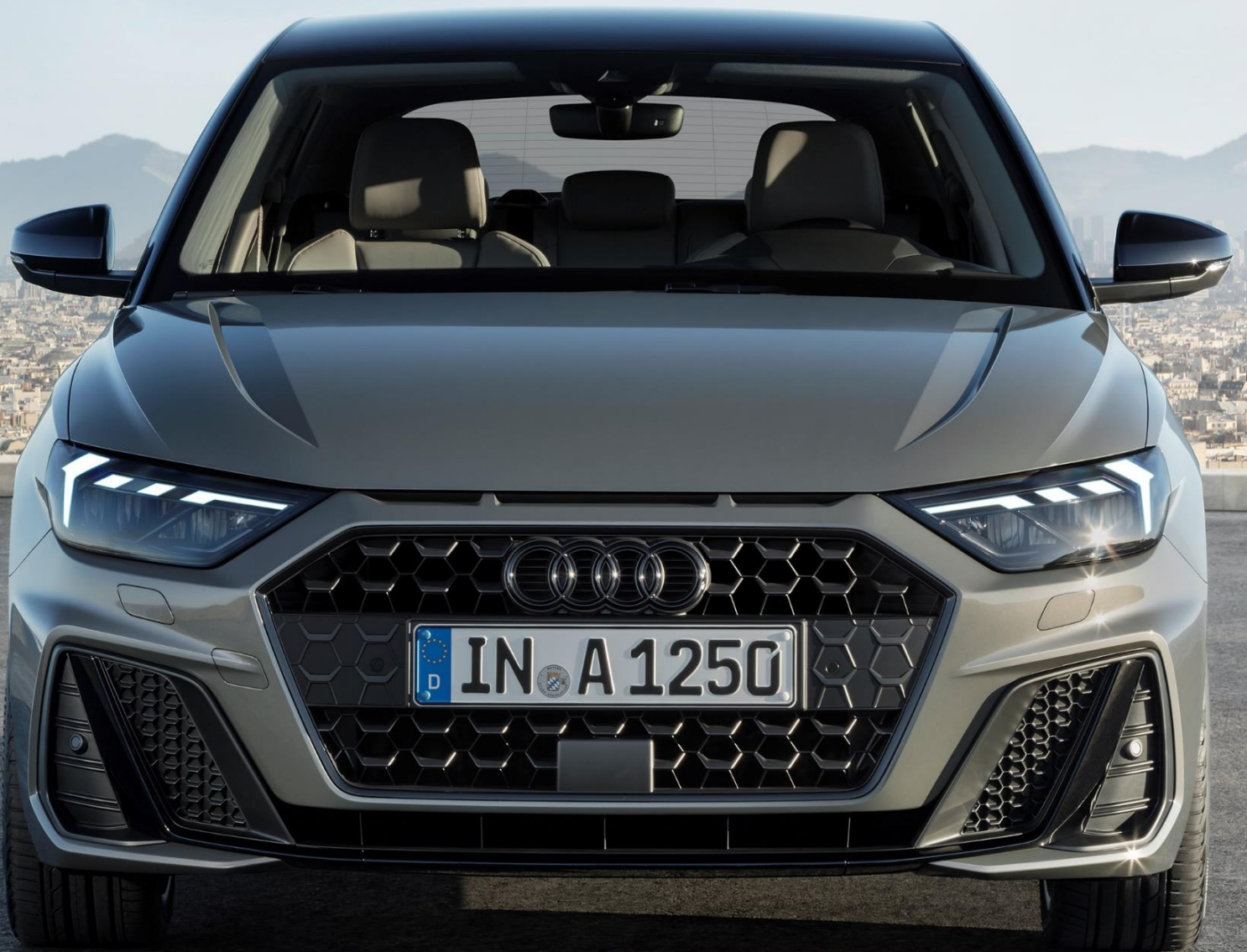
Abbildung zeigt Fahrzeug des Produktionsjahrs 2018 mit optionaler Sonderausstattung

* Audi A1 Sportback 25 TFSI, Schaltgetriebe, 70 kW: Kraftstoffverbrauch (kombiniert): 5,7 - 5,3 l/100 km; CO 2 -Emissionen (kombiniert): 129 - 120 g/km; CO 2 -Klasse: D